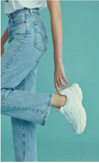
Denim Pantolon Levi's 309.90 TL