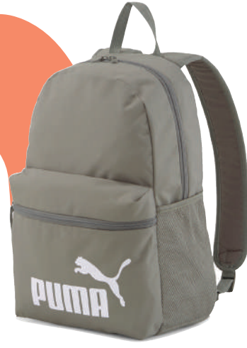
Sirt Çantası Puma 159.90 TL