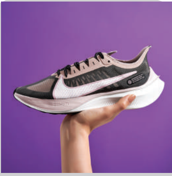
Koşu Ayakkabısı Nike 482.97 TL