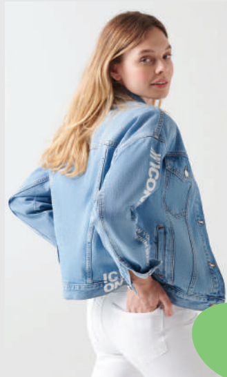
Denim Ceket Mavi 249.99 TL