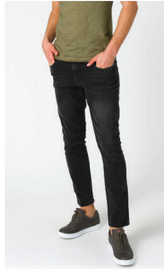
Denim Pantolon Lee Cooper 199.90 TL