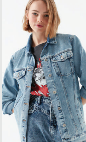
Denim Ceket Mavi 229.99 TL