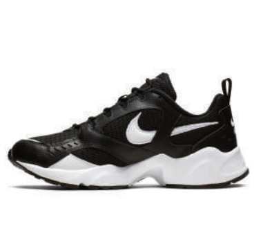
Lifestyle Ayakkabı Nike 529.90 TL