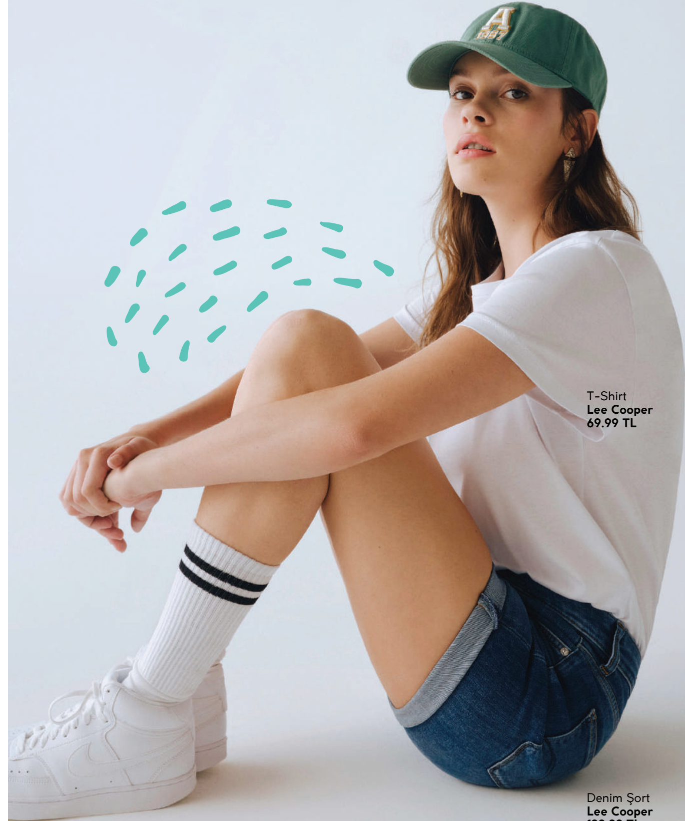
T-Shirt Lee Cooper 69.99 TL