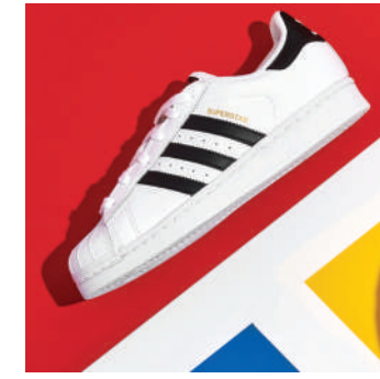
Lifestyle Ayakkabı Adidas 799.90 TL