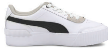
Lifestyle Ayakkabı Puma 509.90

Şimdi, klasik ayakkabılarınızı evde bırakma ve sneakerlarınızla rahatınıza bakma zamanı.