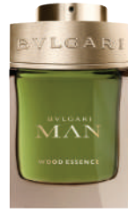
Erkek Parfüm Bulgari 770 TL