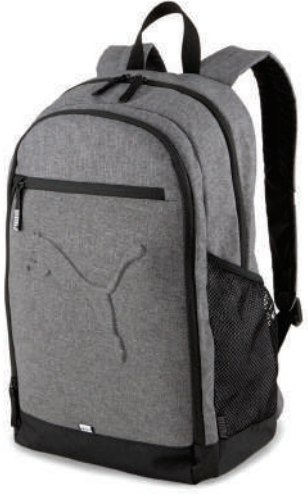
Sirt Çantası Puma 249.90 TL