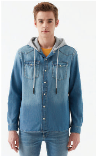
Denim G mlek Mavi 115.76 TL

Jean pantolon ve  ortlar, denim ceket ve g mleklerle uyumlu birlikteliklerini sergilemeye devam ediyor. Bu ayrılmaz ikiliye eŐlik eden western stili bir kemer ya da denim ceket i inden kendini g steren renkli bir sweatshirt, bir anda her Őeyi deĐiŐtirebilir.