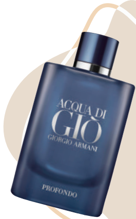
Erkek Parfüm Giorgio Armani 950 TL