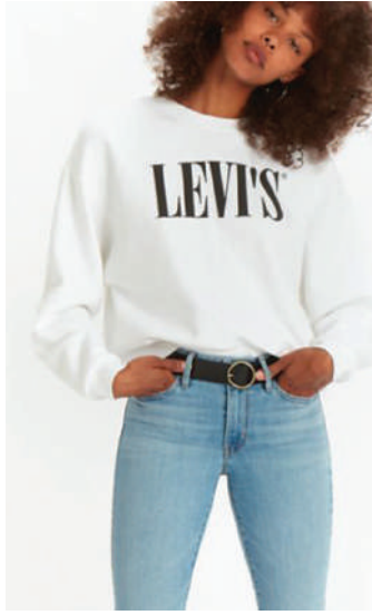
Denim Pantolon Levi's 189.90 TL