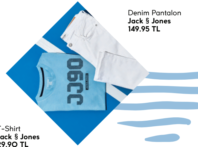
T-Shirt Jack & Jones 29.90 TL