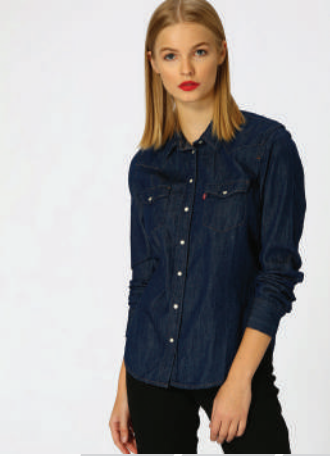
Denim Gömlek Levi's 139.90 TL