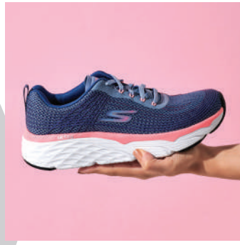
Koşu Ayakkabısı Skechers 899 TL