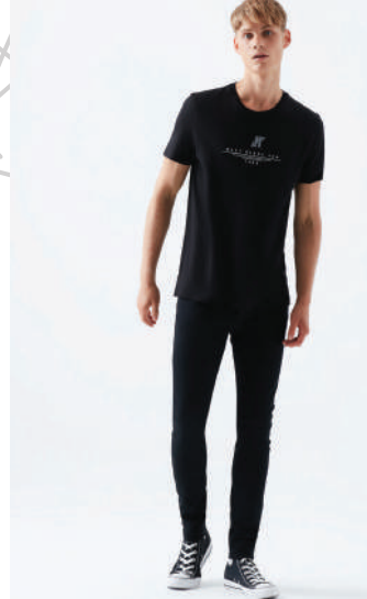
Denim Pantolon Mavi 134.97 TL