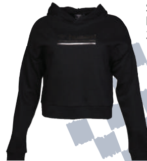
Sweat Shirt Hummel 269.99 TL