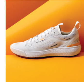
Lifestyle Ayakkabı Vans 919 TL