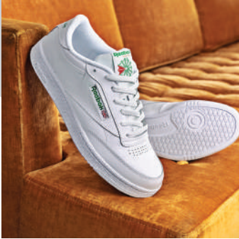
Lifestyle Ayakkabı Reebok 579 TL