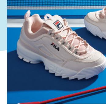
Lifestyle Ayakkabı Fila 799 TL