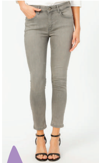
Denim Pantolon Fabrika 249.95 TL