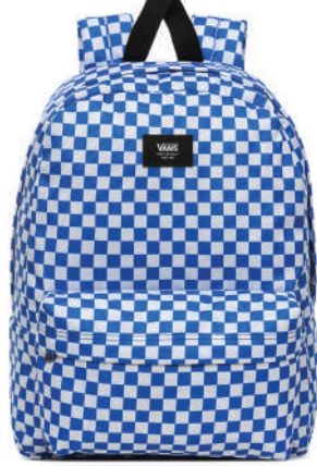
Sirt Çantası Vans 254 TL