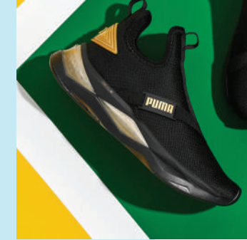
Koşu Ayakkabısı Puma 799.90 TL

Şimdi, klasik ayakkabılarınızı evde bırakma ve sneakerlarınızla rahatınıza bakma zamanı.