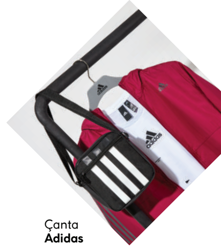
Çanta Adidas 135 TL