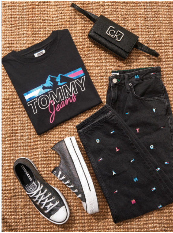
Sneaker Converse 629 TL