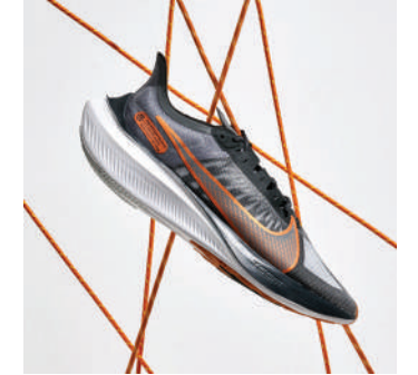
Koşu Ayakkabısı Nike 482.97 TL