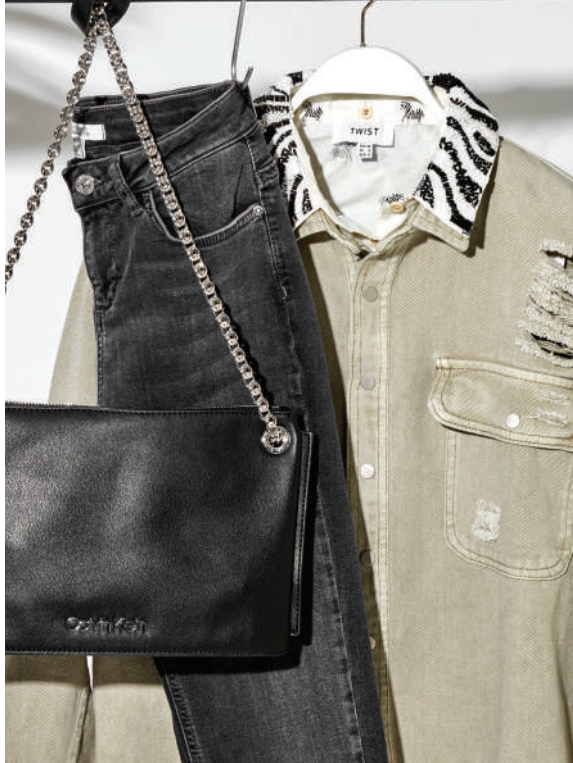
Denim Pantolon İpekyol 229 TL