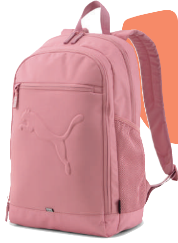
Sirt Çantası Puma 249.90 TL