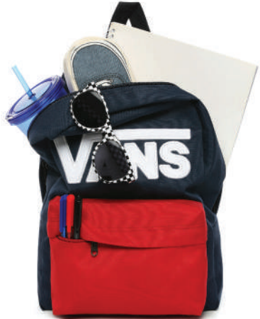
Sirt Çantası Vans 229 TL