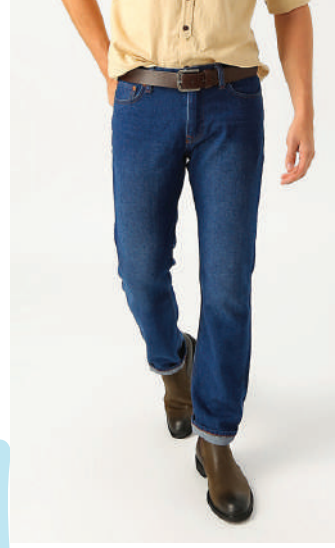
Denim Pantolon Loft 139.99 TL