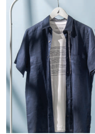
Gömlek Nautica 201.04 TL