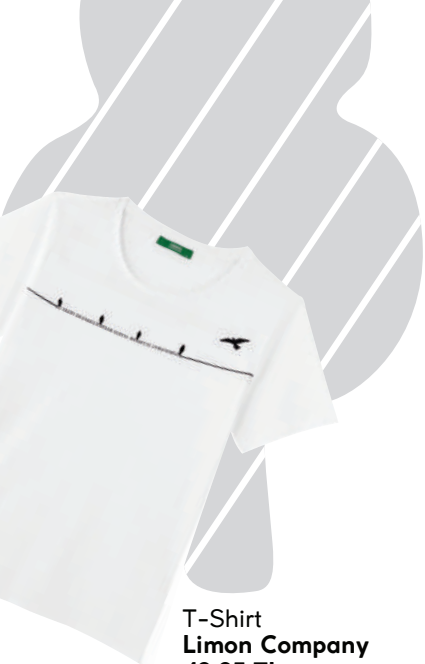
T-Shirt Limon Company 49.95 TL