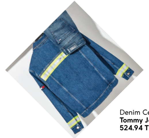
Denim Ceket Tommy Jeans 524.94 TL