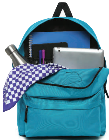
Sirt Çantası Vans