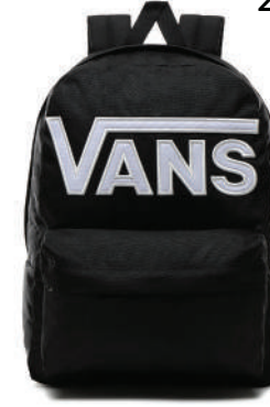
Sırt Çantası Vans 254 TL