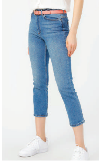
Denim Pantolon Limon 159.95 TL