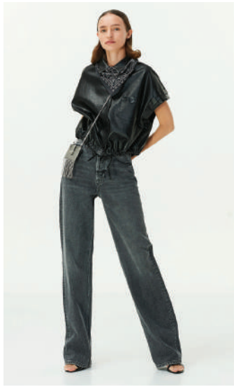
Denim Pantolon Twist 499 TL