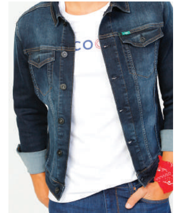
Denim Ceket Lee Cooper 389.99 TL