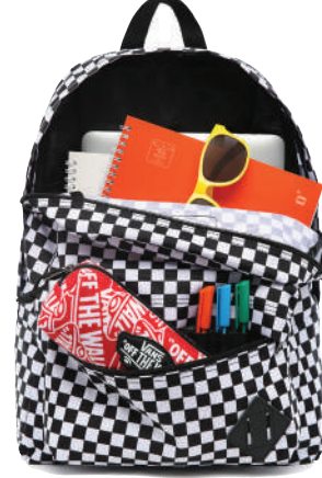
Sirt Çantası Vans 254 TL