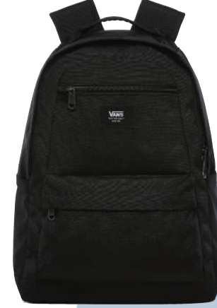
Sirt Çantası Vans