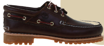
Ayakkabı Timberland 1399 TL