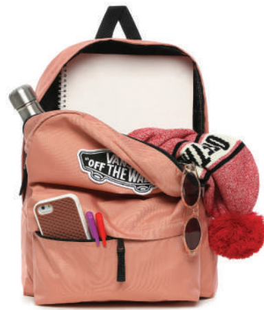
Sirt Çantası Vans