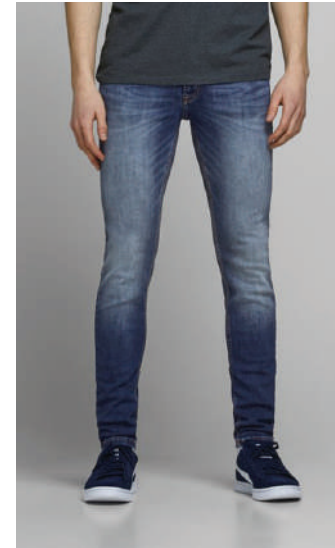
Denim Pantolon Lee Cooper 199.90 TL