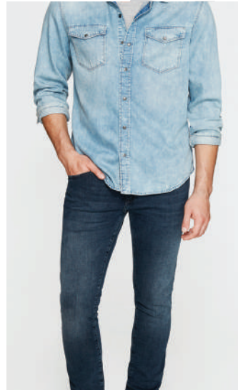
Denim Pantolon Lee Cooper 239.99 TL