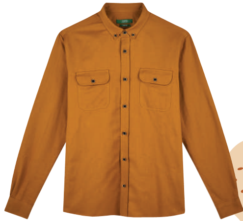
Gömlük Limon 129.95 TL