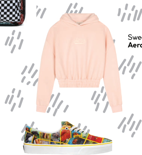
Sweat Shirt Aeropostal