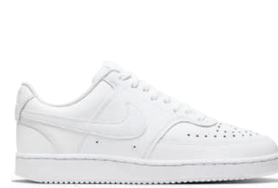
Lifestyle Ayakkabı Nike 479.90 TL