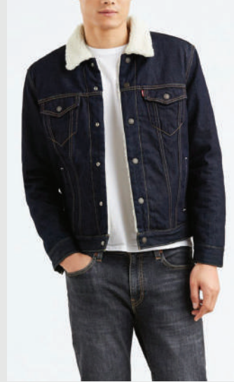
Denim Ceket Levi's 699 TL