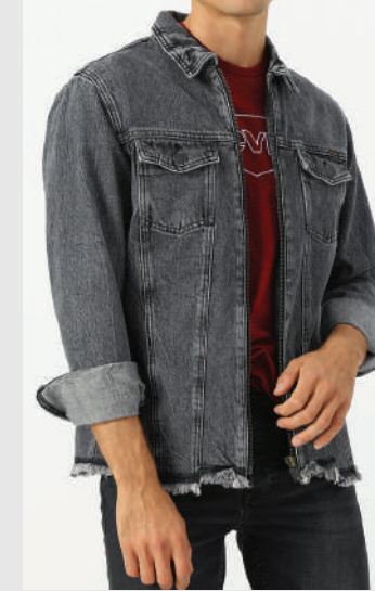
Denim Ceket Jack & Jones 209.99 TL