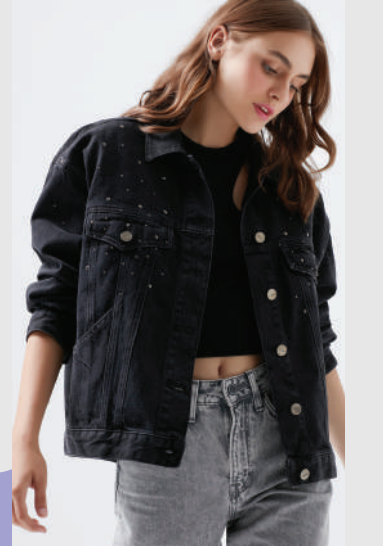
Denim Ceket Mavi 249.99 TL