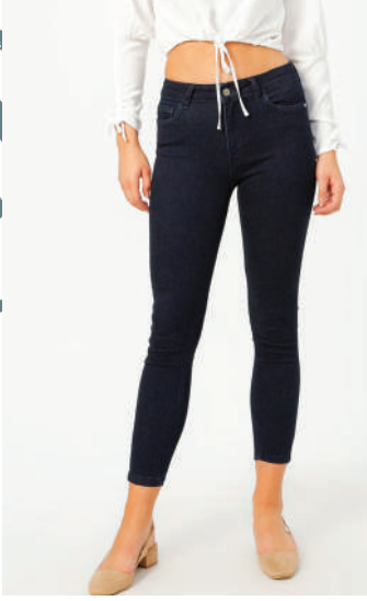
Denim Pantolon Fabrika 254.95 TL