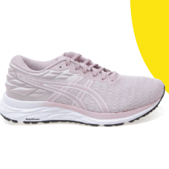
Koşu Ayakkabısı Asics 459.95 TL