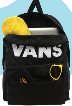
Sirt Çantası Vans 254 TL