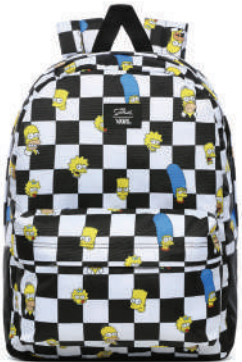
Sirt Çantası Vans 254 TL

Rock'n'roll ruhlu siyah jean, yeniden sahnede! Siyah jeanin asi ve asil duruşunu başka siyahlarla daha da güçlendirmek elinizde.