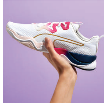
Koşu Ayakkabısı Puma 639.90 TL