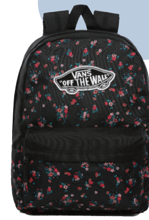
Sirt Çantası Vans 269 TL

Hayatlarımız her geçen gün biraz daha mobil hale geliyor; gün içinde oradan oraya taşıdığımız yüklerimiz artıyor. Sirt çantaları, işte bu günler için var! Sezonun öne çıkan modelleri, jeanlerinize eşlik etmeye hazır, renk ve desenleri itibarıyla arka planda kalamayacak kadar iddialı.