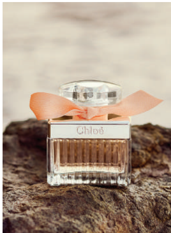
Kadın Parfüm Chloé 730 TL