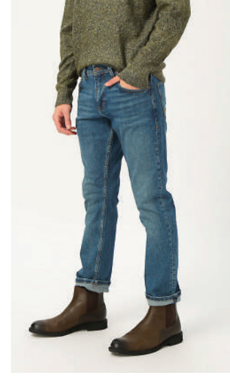
Denim Pantolon Mustang 144.98 TL