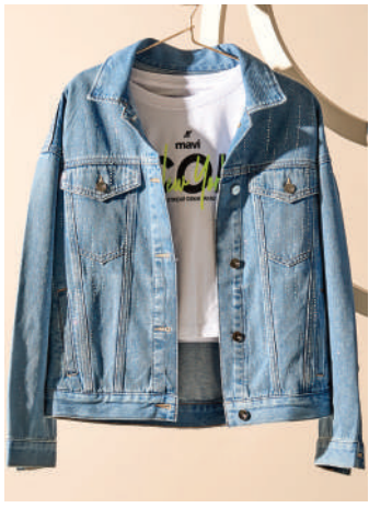
Denim Ceket Mavi 249.99 TL

Moda dünyasının her daim başrolündeki jeanler, bu kalıcı rolü, biraz da her türlü kıyafetle sergiledikleri uyumlu birlikteliğe borçlu. Sezonun alışveriş listelerinde üst sıralara yerleşen seçenekleri denim stilinize uyarlayın ve sonbahara havalı bir geçiş yapın.