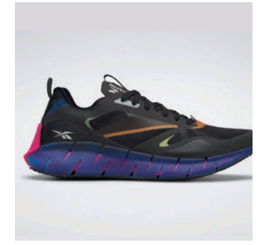
Koşu Ayakkabısı Reebok 789 TL