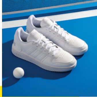
Lifestyle Ayakkabı Adidas 419 TL