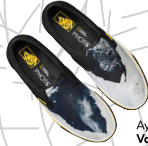
Ayakkabı Vans x National Geographic 664 TL