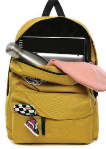
Sirt Çantası Vans 254 TL