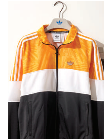
Eşofman Üstü Adidas