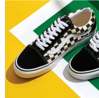
Lifestyle Ayakkabı Vans 589 TL