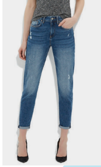
Denim Pantolon Mavi 179.99 TL