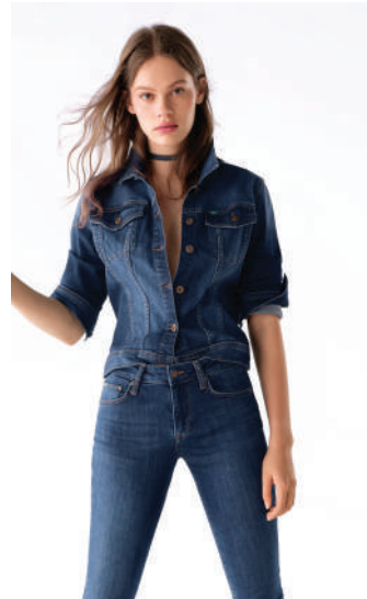
Denim Pantolon Lee Cooper 239.99 TL