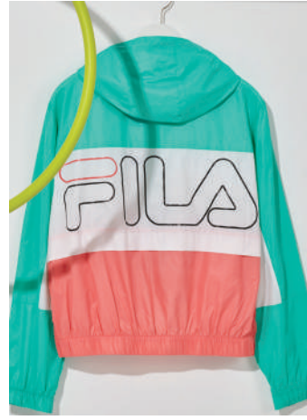
Sweat Shirt Fila 489 TL

Moda dünyasının her daim başrolündeki jeanler, bu kalıcı rolü, biraz da her türlü kıyafetle sergiledikleri uyumlu birlikteliğe borçlu. Sezonun alışveriş listelerinde üst sıralara yerleşen seçenekleri denim stilinize uyarlayın ve sonbahara havalı bir geçiş yapın.