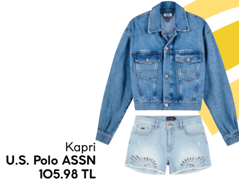
Denim Ceket Lee Cooper 349.99 TL