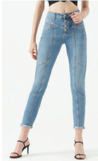
Denim Pantolon Mavi 189.99 TL