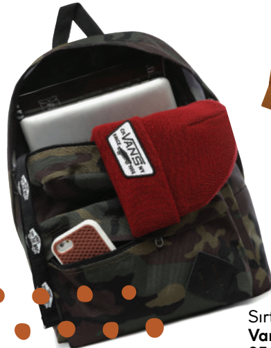
Sırt Çantası Vans 254 TL