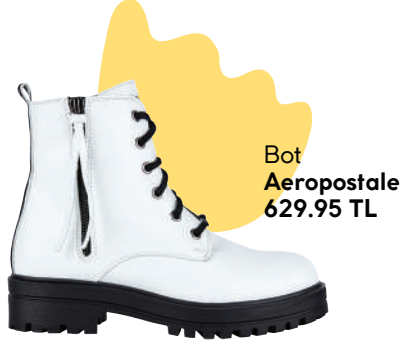
Bot Aeropostale 629.95 TL