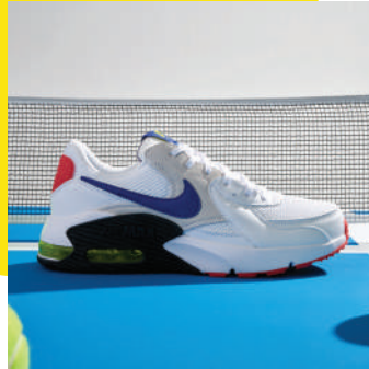
Lifestyle Ayakkabı Nike 799.90 TL