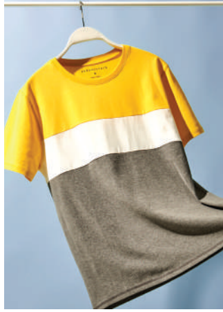
T-Shirt Aeropostale 89.95 TL