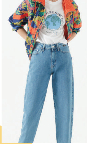
Denim Pantolon Mavi 157.46 TL

Zamanın ruhuna ayak uydurmak onun işi! Sokakların resmi ve daimi üniforması denim, şimdi de konforlu kalıplarla yaşadığımız zamanlara adapte oluyor. Bir yandan da farklı zevklere (ve vücut tiplerine) hitap etmek için şekilden şekle giriyor. Sezonun denim paletinde, boru paçalar başrolde. Yüksek beli ve bileğe doğru daralan hacimli silüetiyle 90'ları geri getiren mom jeans, daha feminen kalıplarda yorumlanan yeni Boyfriend ve dar kesimlerden vazgeçemeyenleri heyecanlandıracak yeni sürüm skinny jeanler ile seçenekler artıyor.