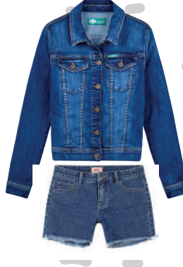
Denim Ceket Lee Cooper 349.99 TL

Jean pantolon ve  ortlar, denim ceket ve g mleklerle uyumlu birlikteliklerini sergilemeye devam ediyor. Bu ayrılmaz ikiliye eŐlik eden western stili bir kemer ya da denim ceket i inden kendini g steren renkli bir sweatshirt, bir anda her Őeyi deĐiŐtirebilir.