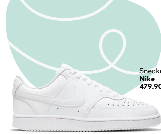
Sneaker Nike 479.90 TL