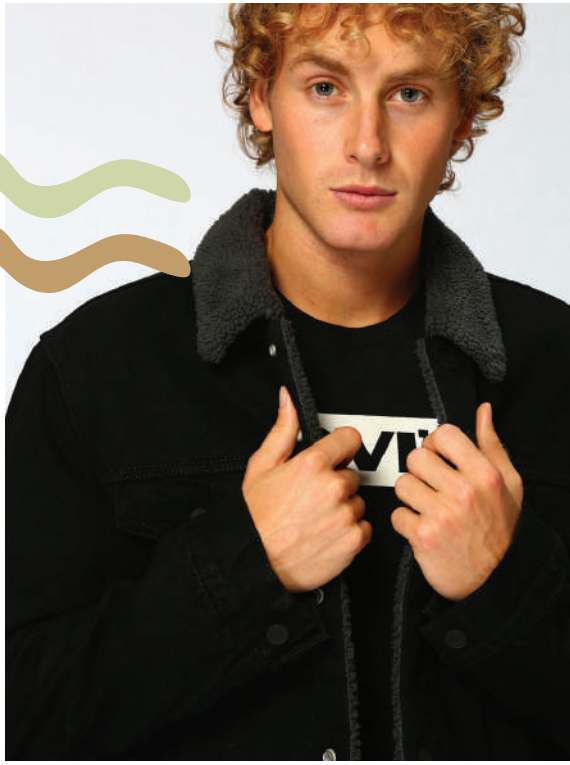
Mont Levi's 699.90 TL