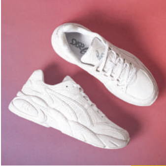
Koşu Ayakkabısı Asics 369.95 TL