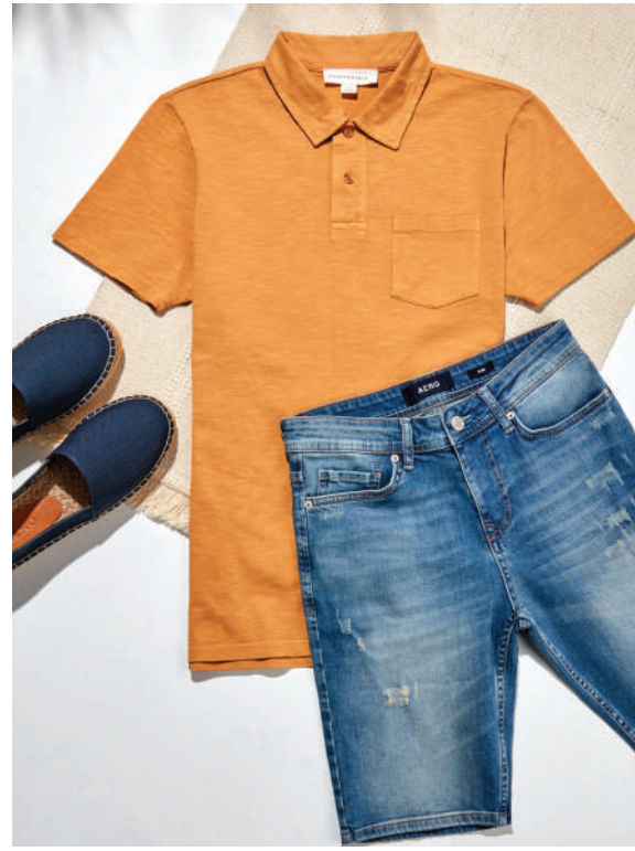
Ayakkabı Aeropostale 79.95 TL