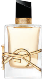
Parfüm Yves Saint Laurent 375 TL