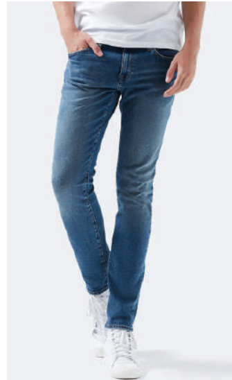
Denim Pantolon Mavi 189.99 TL