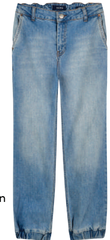
Denim Pantolon Aeropostal 119.95 TL