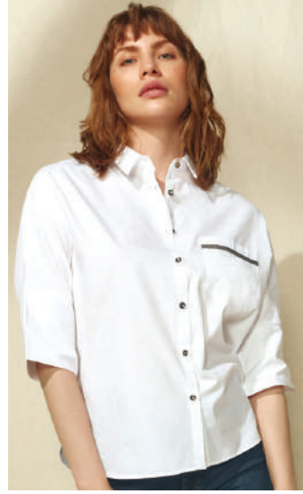
Gömlek Fabrika 59.98 TL