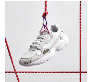
Lifestyle Ayakkabı Adidas 849 TL