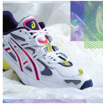
Lifestyle Ayakkabı Asics 674.95 TL