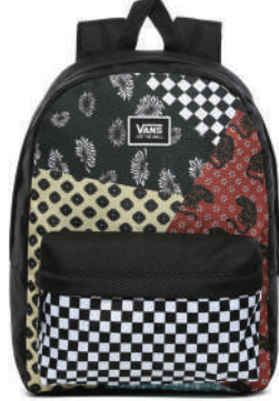
Sırt Çantası Vans 254 TL