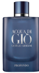
Erkek Parfüm Giorgio Armani 950 TL