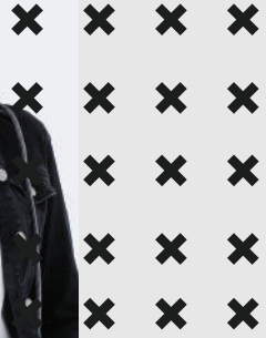
Denim Ceket Mavi 229.99 TL