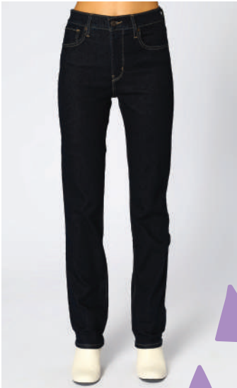
Denim Pantolon Levi's 349.90 TL