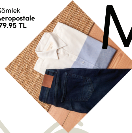
Gömlek Aeropostale 179.95 TL