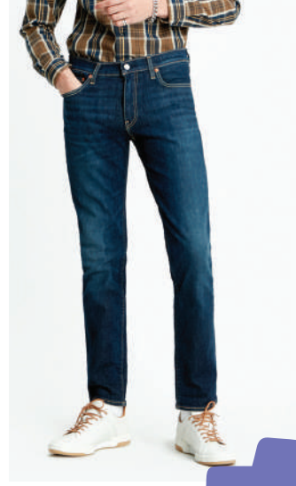
Denim Pantolon Levi's 399.90 TL