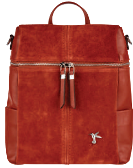
Sırt Çantası, Fabrika 519.95 TL