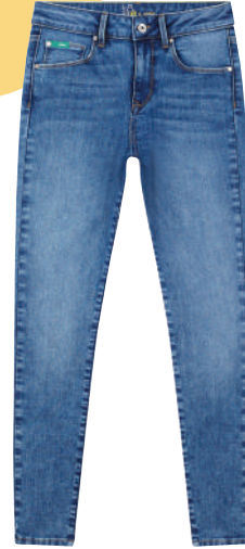
Denim Pantolon Lee Cooper 239.99 TL