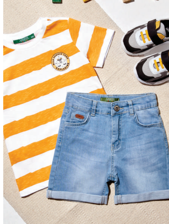
Denim Şort Limon 79.95 TL