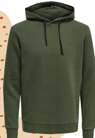
Sweat Shirt Only & Sons 99.95 TL